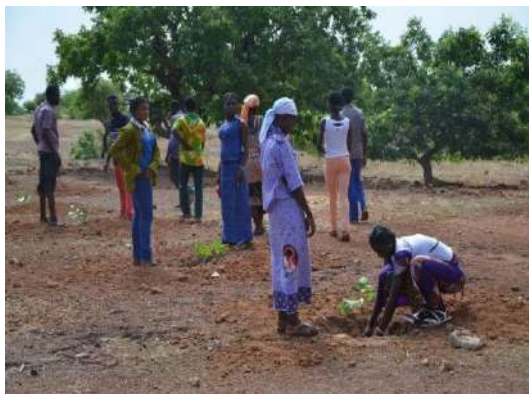
Engagement des enfants, des jeunes et des femmes dans l'activités sur la conservation de l'environnement