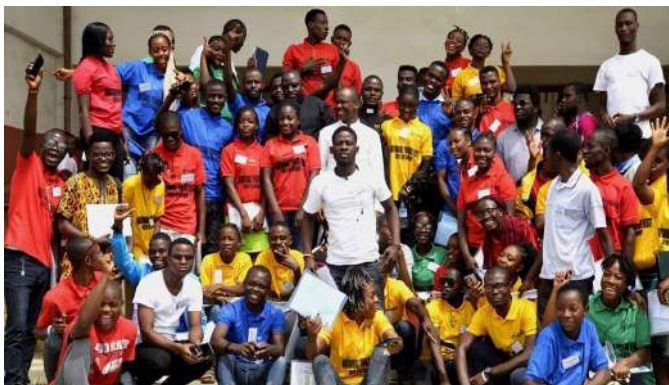
Retraite nationale de la jeunesse, février 2020