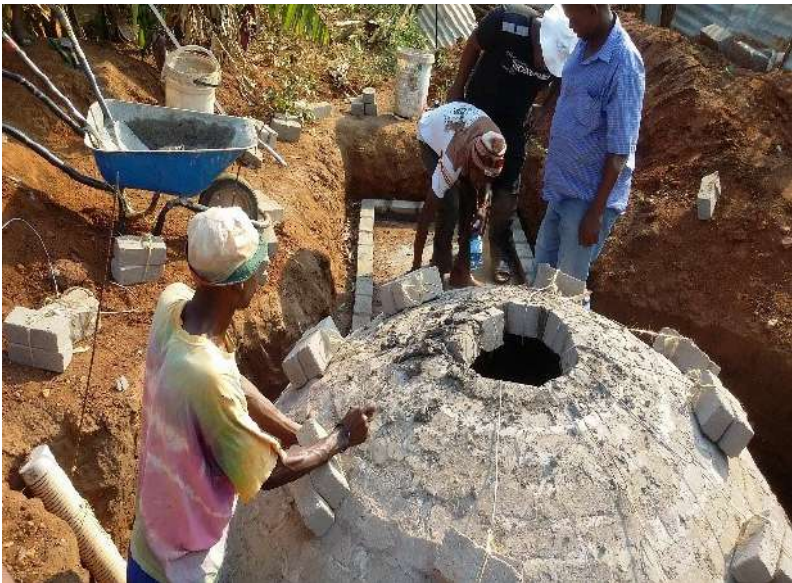
Promotion de l'utilisation du biogaz dans les villages