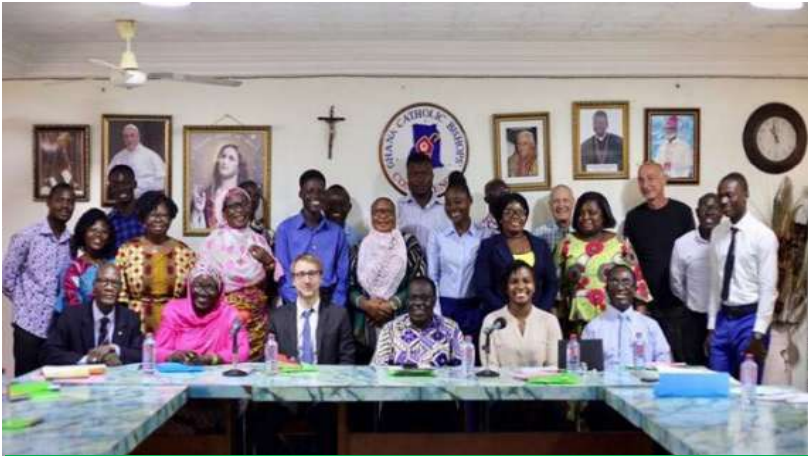
Formation des parties prenantes sur la gestion des déchets électroniques

⇒ Une campagne en cours sur l'allègement de la dette.