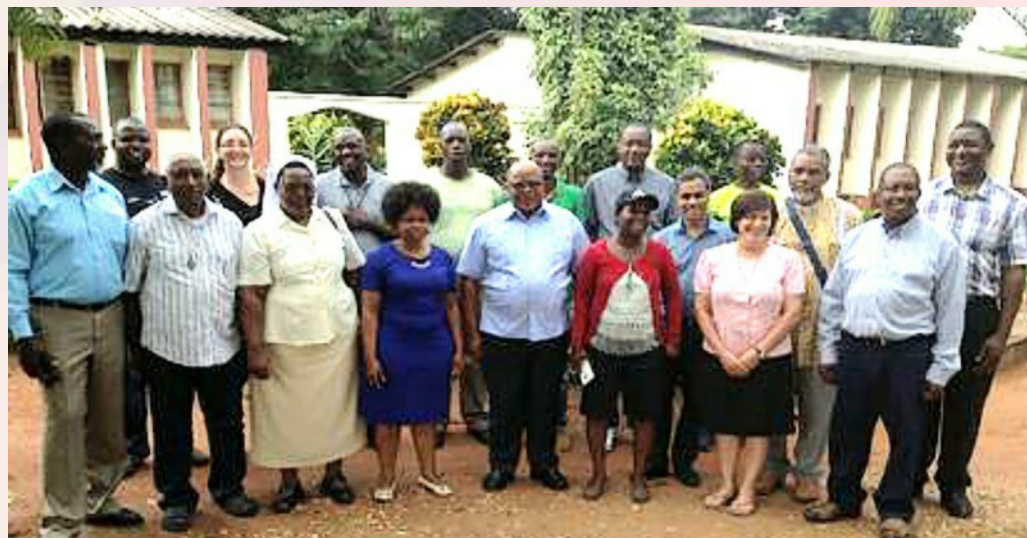
Délégués de Caritas de la zone IMBISA en visite en Zambie : Diocèse de Monze mars 2018.

Les délégués des Caritas d'Afrique du Sud, du Lesotho, de la Namibie et du Swaziland accompagnés des représentants de Caritas Africa et du SG de CI qui ont visité la Caritas Zambie en mars 2018 se sont accordés pour trouver enrichissants et stimulants les échanges sur la structuration de Caritas Zambie, ses modes d'intervention, les défis d'implantation de Caritas Zambie au niveau national, diocésain (Monze) et paroissial (Chowa). Les connaissances produites par Caritas Zambie autour du projet de renforcement socio-économique durable de Cheeba ont intéressé les visiteurs.