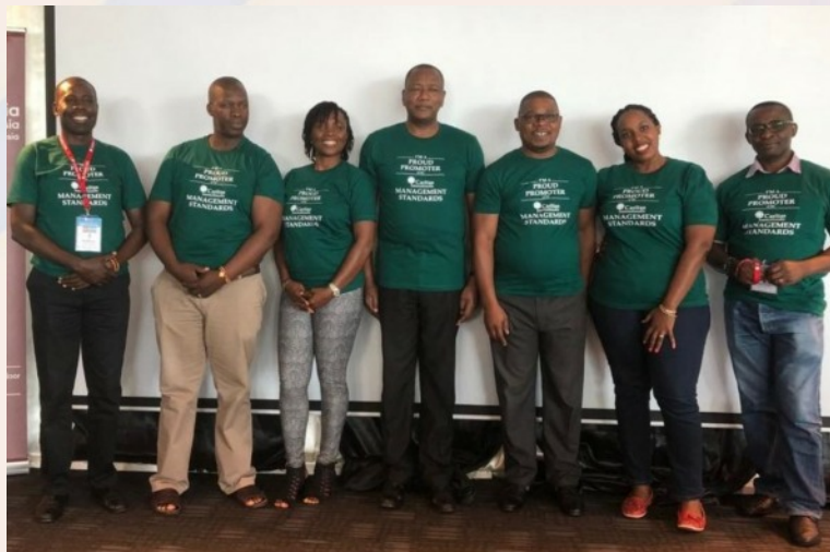
Formation des formateurs pour les Coordonnateurs des Normes de Gestions de Caritas Internationalis à Bangkok, Thaïlande - Novembre 2018.