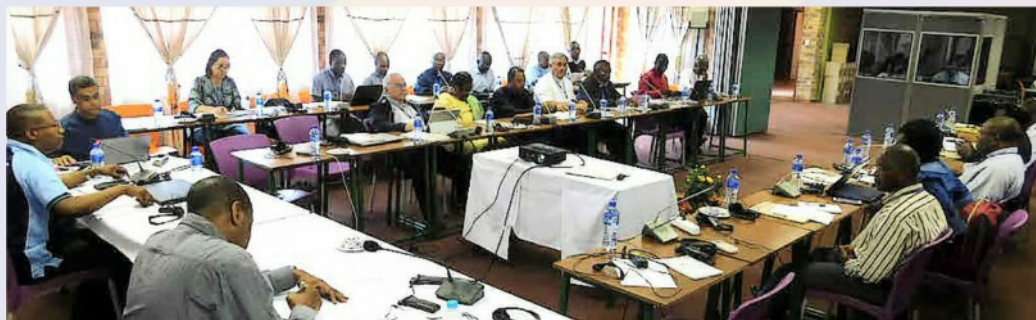
Rencontre des Evêques de la Zone IMBISA, organisée par Caritas Africa en collaboration avec Caritas Internationalis.

Tous les participants à cette rencontre, notamment les Évêques, ont bénéficié d'une formation accélérée sur les NGCI donnée par une équipe du CRS/ Southern Africa Regional Office et du Secrétariat Général de Caritas Internationalis.