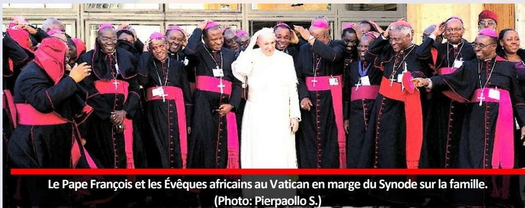
Le Pape François et les Evêques africains au Vatican en marge du Synode sur la famille.

Les interventions de Caritas Africa et de ses Organisations Membres furent ancrées dans les Saintes Écritures et les directives du Magistère qui guident sa mission comme organe technique de l'Eglise dans l'organisation du service de la charité.