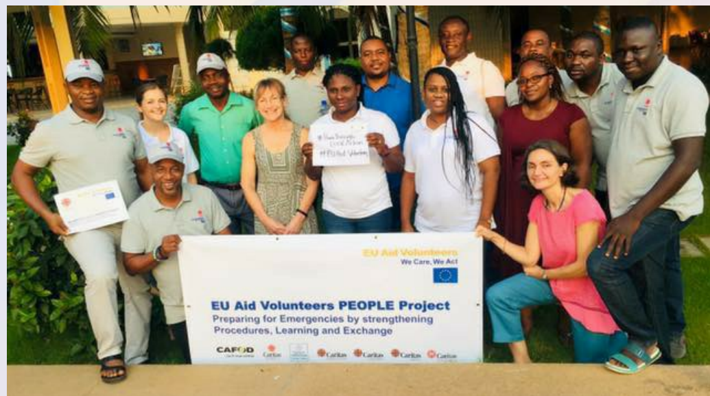
Formation dans le cadre du projet PEOPLE à Lomé - novembre 2018.

for Emergency by strengthening Organisational Procedures, Learning and Exchange » en sigle PEOPLE, est mis en œuvre par Caritas Africa, Caritas Liberia, Caritas Nigeria, Caritas Sierra Leone et Caritas Zimbabwe. Il est co-financé par la Commission Européenne et le consortium CAFOD ( Lead ), Secours Catholique – Caritas France, Caritas Africa et Catholic Relief Services.