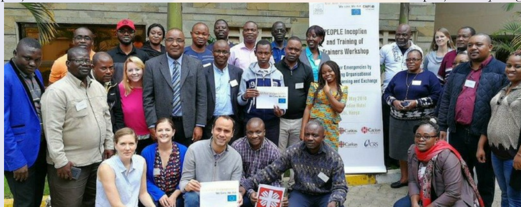
Formation dans le cadre du projet PEOPLE à Nairobi - mai 2018.

Pour accroître les capacités de réponse efficace aux urgences, Caritas Africa a démarré le projet PEOPLE dont le lancement eut lieu à Nairobi en mai 2018. Le projet « Preparing