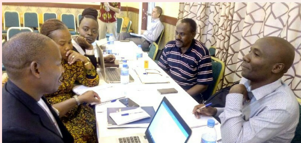
Participants à une formation en vue du renforcement de capacités - Caritas Tanzanie.

Des formations pertinentes ont été organisées pour accroître les aptitudes des acteurs des Caritas d'Afrique à offrir des services de qualité, empreints de respect de la dignité humaine, aux personnes servies.