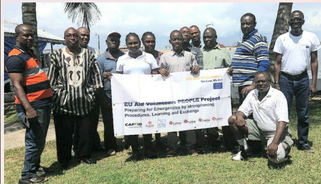
Formation dans le cadre du projet PEOPLE à Monrovia, Libéria.

Les principales activités réalisées au niveau régional furent : l'organisation des rencontres de Rome et de Paris pour préparer le démarrage du projet, l'atelier de lancement à Nairobi, l'atelier de formation des formateurs sur la boîte à outils de CI consacrée aux Urgences et la Gestion des volontaires, l'auto-évaluation des capacités humanitaires de Caritas Africa et le développement de son plan de renforcement des capacités en cette matière.