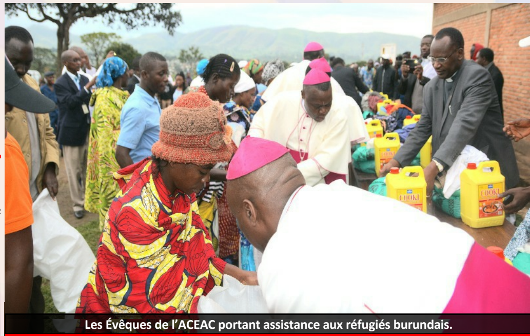
Les Evêques de l'ACEAC portant assistance aux réfugiés burundais.

Dans les pays et les sous-régions de l'Afrique touchés par les conflits violents, les inondations ou les sécheresses saisonnières, les Caritas ont pris en charge en urgence les populations affectées sans aucune discrimination. Aide alimentaire, soins de santé, prise en charge psychologique ont été fournis aux populations affectées. « J'avais faim et vous m'avez donné à manger » Mat 25 : 35.