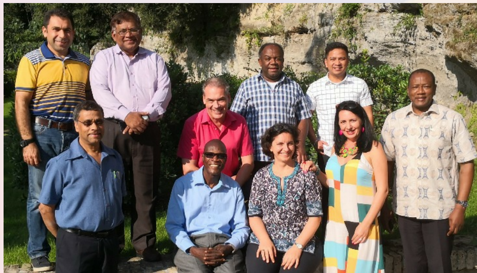
Participation de Caritas Africa à un atelier d'élaboration de modules de formation des formateurs pour coordonnateurs et évaluateurs des Normes de Gestion de CI.

Un consultant en Gestion de Ressources Humaines a appuyé en août 2018 le Secrétariat Exécutif Régional de Caritas Africa en vue de concevoir une politique des Ressources Humaines équitable, appropriée au Bureau régional et dont pourront s'inspirer d'autres organisations socio-caritatives de l'Eglise.