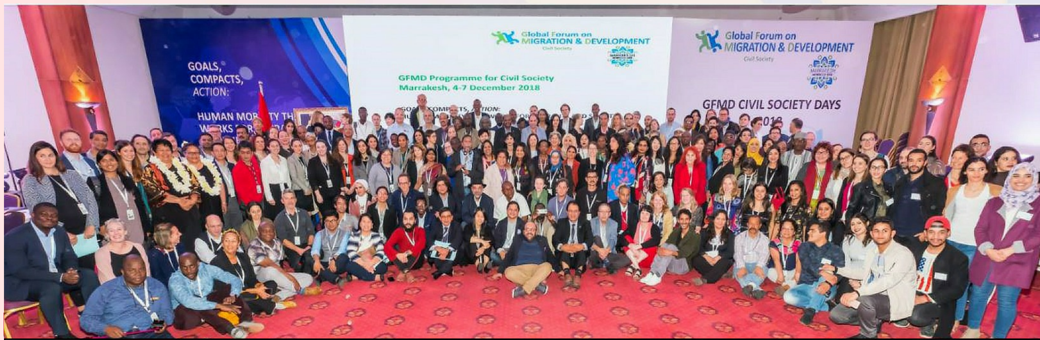
Les participants à la rencontre sur l'adoption du « Global Compact on Safe and Regular Migration » à Marrakech, au Maroc, en décembre 2018.

Des contacts établis avec l'Union Africaine, l'UNECA et la Banque Africaine de Développement devront être poursuivis et consolidés en 2019. L'ouverture à travailler avec d'autres Organisations de la Société Civile (OSC) a été amorcée avec la participation de Caritas Africa (Secrétariat régional, Caritas Kenya, Caritas Uganda et Caritas Tanzanie) à un évènement des