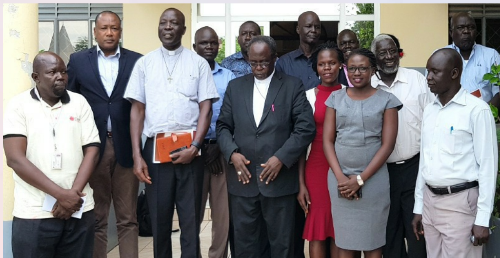
Visite de solidarité du Président et du Secrétaire exécutif de Caritas Africa à la Caritas du Soudan du Sud.

Les visites de solidarité réalisées auprès de l'OCADES-Caritas Burkina, Caritas Congo, Caritas Zambie, Caritas Soudan du Sud, Caritas Côte d'Ivoire (Forum sur les actions