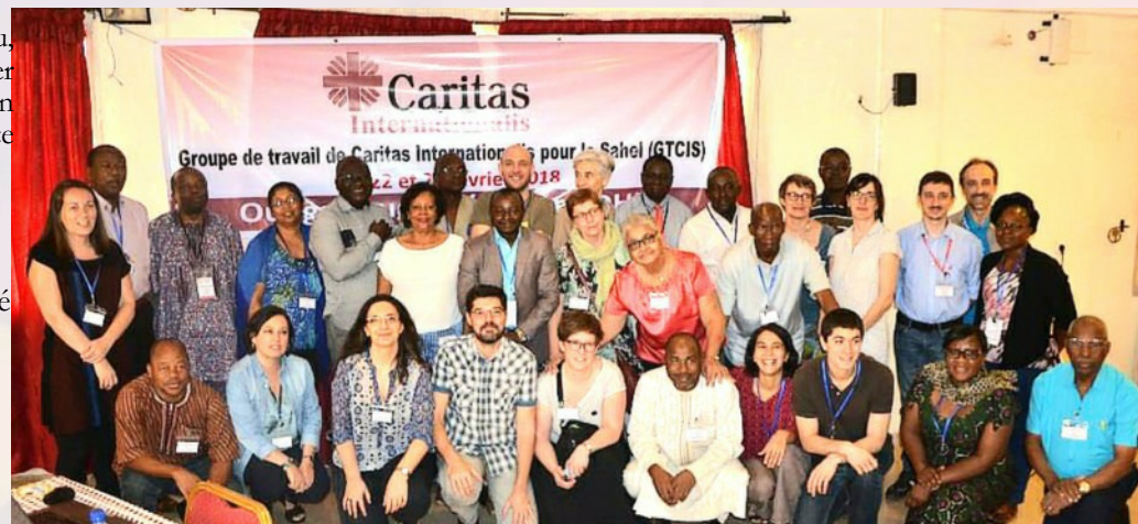
Les participants à la rencontre du Groupe de travail de Caritas Internationalis pour le Sahel.

Faso, du 22 au 23 février 2018. Cette rencontre a été précédée d'une formation sur la mobilité humaine du 19 au 21 février. Cette formation a connu la participation des délégués de 20 organisations membres du GTCIS, des délégués d'autres zones de la Région Afrique (Kenya/ AMECEA, Ile Maurice /CEDOI-M et du SG/ACEAC) et d'autres organisations socio pastorales de l'Eglise et de la société civile.