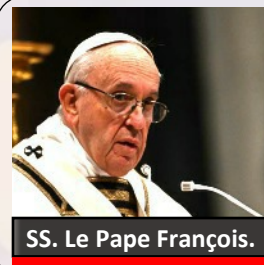
SS. Le Pape François.

De leur côté, les Organisations membres ont également organisé diverses formations. Par exemple, une session de formation de quatre jours sur la gestion des ressources financières, l'élaboration de projets et la mobilisation des ressources fut organisée par Caritas Tanzanie. Ont pris part à cette formation des Coordinateurs diocésains, des Comptables et des Chefs de projets des six Diocèses de Tanzanie.