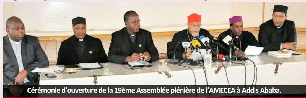
Cérémonie d'ouverture de la 19ème Assemblée plénière de l'AMECEA à Addis Ababa.

La 19 e Assemblée Plénière des Evêques de la Zone AMECEA tenue à Addis-Abéba (Ethiopie) en juillet 2018, l'atelier préparatoire de lancement de l'année jubilaire du SCEAM à Kampala (Ouganda) en juillet 2018 ainsi que la rencontre des Evêques de la Zone IMBISA à Prétoria (Afrique du Sud) en octobre 2018 furent des espaces et des opportunités d'écoute active des Evêques et de présentation de l'action de Caritas Africa et de défis qu'elle rencontre dans sa mission.