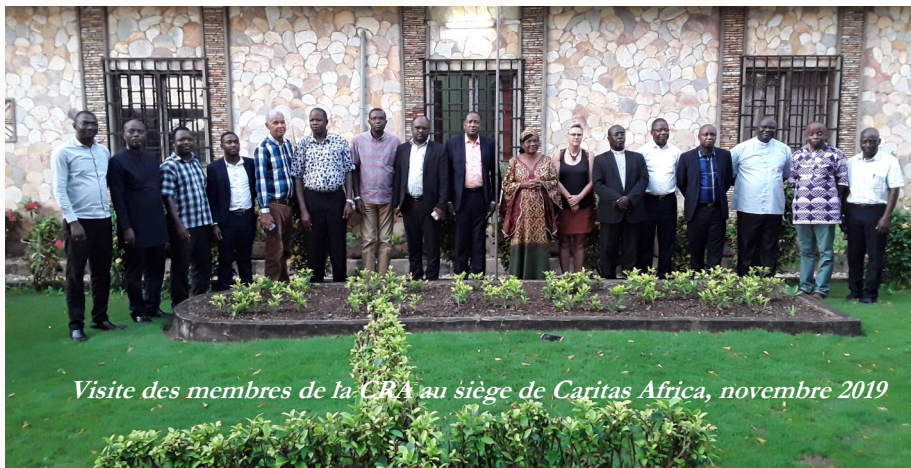
Visite des membres de la CRA au siège de Caritas Africa, novembre 2019

Au niveau Régional , en 2019, Caritas Africa a tenu trois rencontres de la Commission Régionale Afrique (Kampala en mars, Rome en mai et Lomé en novembre).