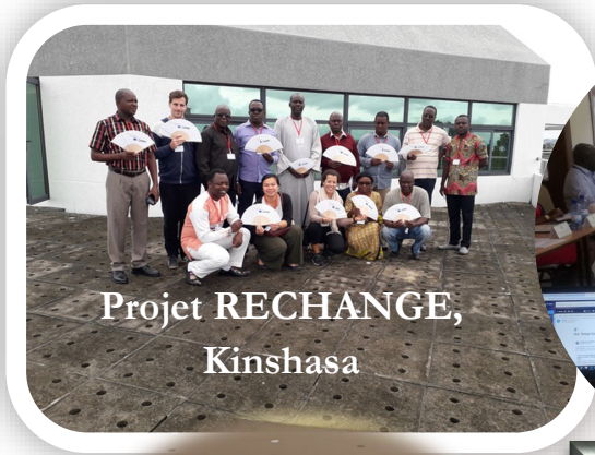
Projet RECHANGE, Kinshasa