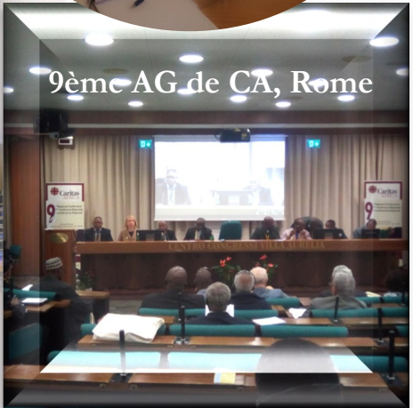
9ème AG de CA, Rome