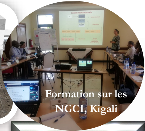
Formation sur les NGCI, Kigali