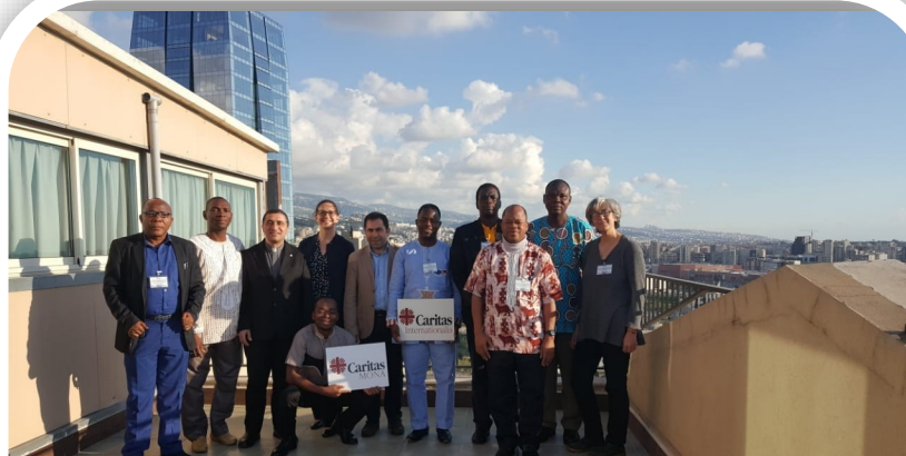
Formation des évaluateurs francophones dont 5 de la Région Afrique, à Beyrouth au Liban en mai 2019.

Selon le Rapport du Secrétariat Général de CI, à ce jour, la situation de la mise en œuvre des Normes de Gestion au sein de la Région Afrique est la suivante :