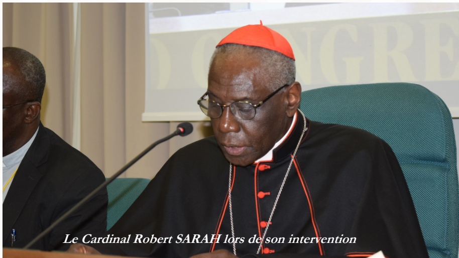
Le Cardinal Robert SARAÏ lors de son intervention

de l'exhortation post-synodale "Africae Munus" » et la communication du Cardinal Robert SARAÏ sur « Identité et mission de Caritas dans le contexte africain » ont largement abordé la question de l'Identité et de la Mission de Caritas.