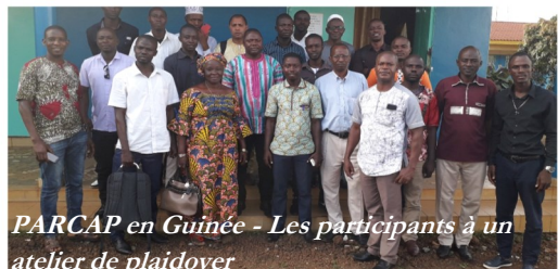
PARCAP en Guinée - Les participants à un atelier de plaidoyer

PARCAP concerne 6 Caritas (Guinée, Niger, RDC, Madagascar, Ghana, Ouganda et Zambie) avec un appui financier du SG de CI. Caritas Africa accompagne les 6 pays dans la mise en œuvre de leurs plans d'actions en matière de plaidoyer pour le droit à l'alimentation . Ce projet a pris fin en décembre 2019.