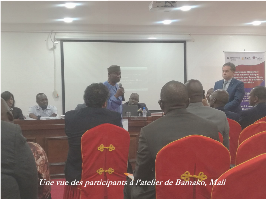
Une vue des participants à l'atelier de Bamako, Mali

Caritas Africa, Caritas Mali, Banca Popolare Etica et la Banque Malienne de Solidarité ont organisé, du 20 au 22 mars 2019 à Bamako au Mali, une Conférence régionale sur Financer l'avenir : quel rôle pour le finance éthique et basée sur la valeur en Afrique . Cinq (5) Institutions de Microfinance issues des Caritas d'Afrique subsaharienne (GRAINE SARL du Burkina Faso, IFOD SARL de la RDC, RIM du Rwanda, CAURIE MF du Sénégal et METAMANEN de l'Ethiopie) y ont participé.