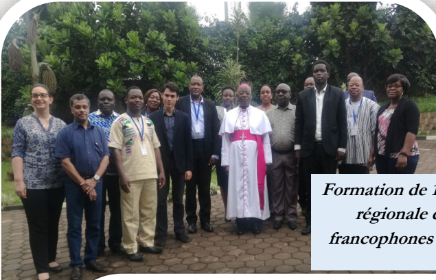
Formation de 15 membres de l'équipe régionale de Coordonneurs francophones à Kigali (février 2019).