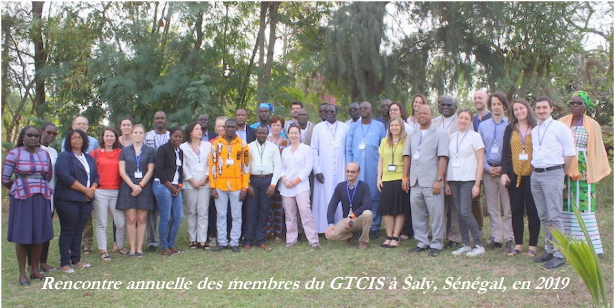
Rencontre annuelle des membres du GTCIS à Saly, Sénégal, en 2019

Le Groupe de Travail de Caritas Internationalis pour le Sahel (GTCIS) s'est réuni pour sa 13 ème Rencontre Annuelle à Saly au Sénégal, les 31 janvier et 1er février 2019. Les représentants de 18 Caritas de la région du Sahel, de l'Europe, des Etats-Unis, de Caritas Africa et de Caritas Internationalis, ont participé à cette rencontre. Avant celle-ci, une session de formation sur la sécurité alimentaire et l'agro-écologie dans un contexte de changement climatique, s'est tenue du 28 au 30 janvier 2019.