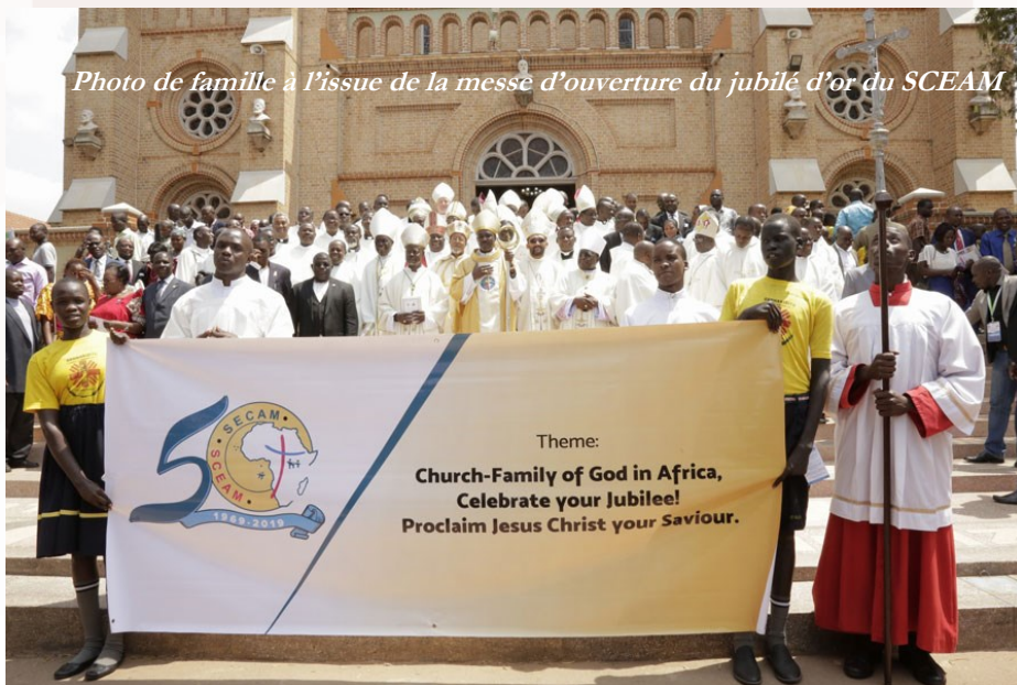
Photo de famille à l'issue de la messe d'ouverture du jubilé d'or du SCEAM

Sur invitation du Secrétariat Général du SCEAM, Caritas Africa a participé à la 18 ème Assemblée Plénière et à la clôture de l'année jubilaire du SCEAM (50 ans de son existence) à Kampala en Ouganda en juillet 2019. A cette occasion, Caritas Africa a délivré un message de solidarité insistant sur le rôle des Evêques dans l'organisation du Service de la Charité et présenté son rapport d'activités triennal (juillet 2016-juin 2019).