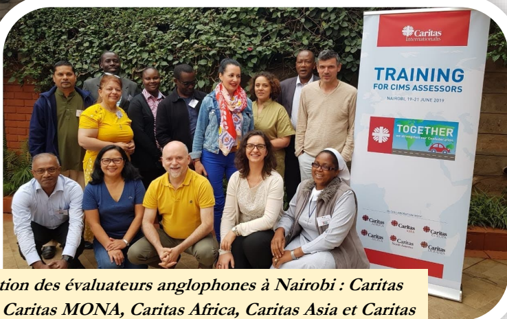
Formation des évaluateurs anglophones à Nairobi : Caritas Europa, Caritas MONA, Caritas Africa, Caritas Asia et Caritas Oceania (juin 2019).