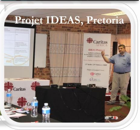
Projet IDEAS, Pretoria