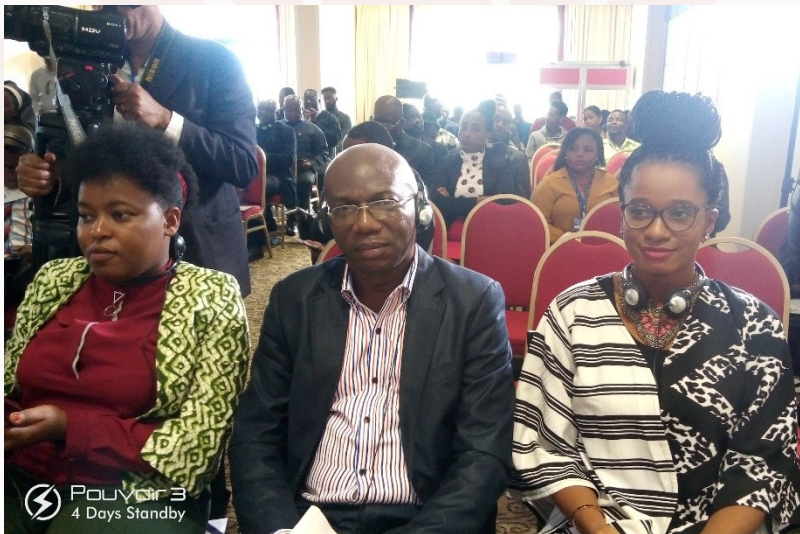
Congrès de SIGNIS à Addis Abeba : de gauche à droite, Caritas Kenya, Caritas Congo Asbl et Caritas Nigeria

SIGNIS Africa a invité Caritas Africa à un congrès qu'il a organisé à Addis Abeba en Ethiopie en septembre 2019 sur le thème « La Jeunesse Africaine dans le monde de la digitalisation : promotion de la créativité pour le développement intégral ». Caritas Africa y a pris part à travers les Chargés de Communication de Caritas Kenya, Nigeria et RDC qui ont posé les bases pour une future collaboration entre ces deux instruments de l'Eglise en Afrique.