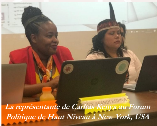
La représentante de Caritas Kenya au Forum Politique de Haut Niveau à New York, USA

- Caritas Kenya a participé du 7 au 14 juillet 2019 à New York au Forum politique de Haut-niveau organisé par les Nations Unies sur les ODD.