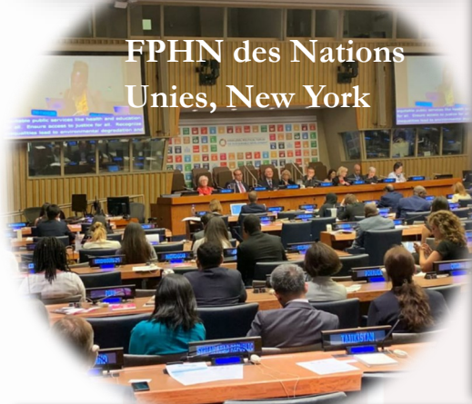
FPHN des Nations Unies, New York