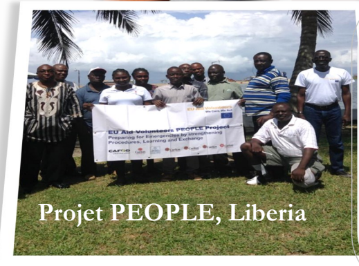
Projet PEOPLE, Liberia