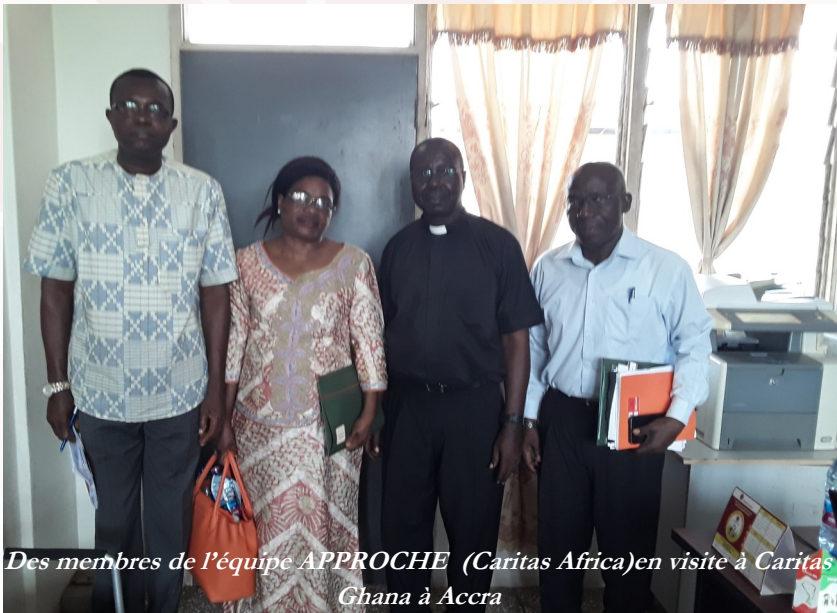
Des membres de l'équipe APPROCHE (Caritas Africa) en visite à Caritas Ghana à Accra