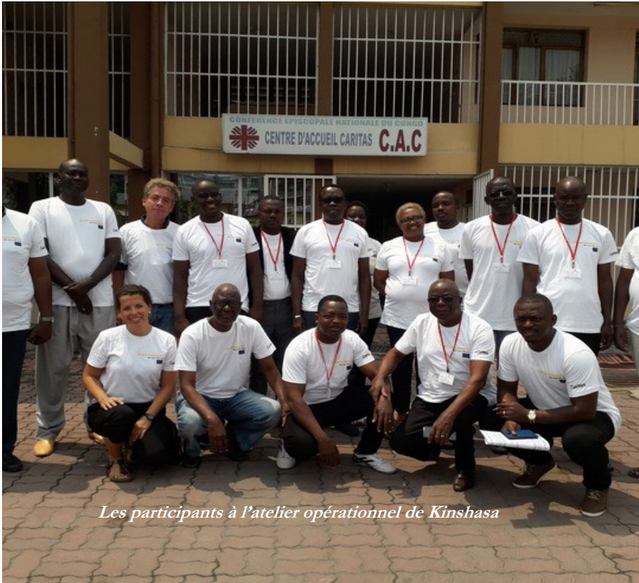
Les participants à l'atelier opérationnel de Kinshasa