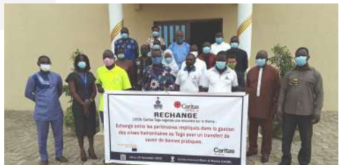
Atelier de Lomé pour l'élaboration du plan d'intervention en situation d'urgence