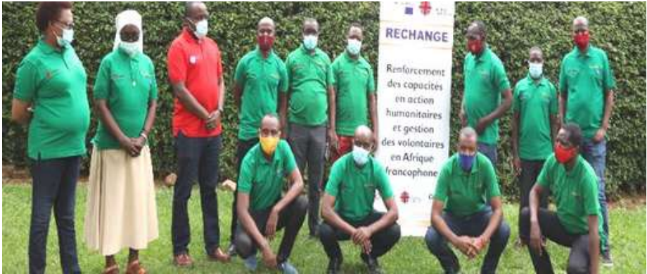
Les participants à l'atelier de Kigali lors de l'exercice de simulation