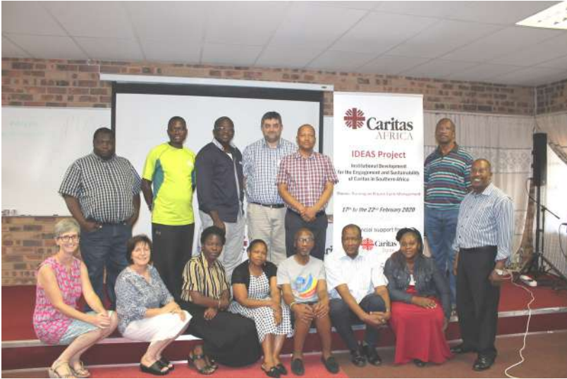
Les participants à la formation sur la Gestion du cycle de projet dans le cadre du projet IDEAS (Institutional Development for the Engagement and Sustainability of Caritas in Southern Africa).

été financés par un fonds mis en place par le Dicastère pour le Service du Développement Humain Intégral et le SG de Caritas Internationalis.