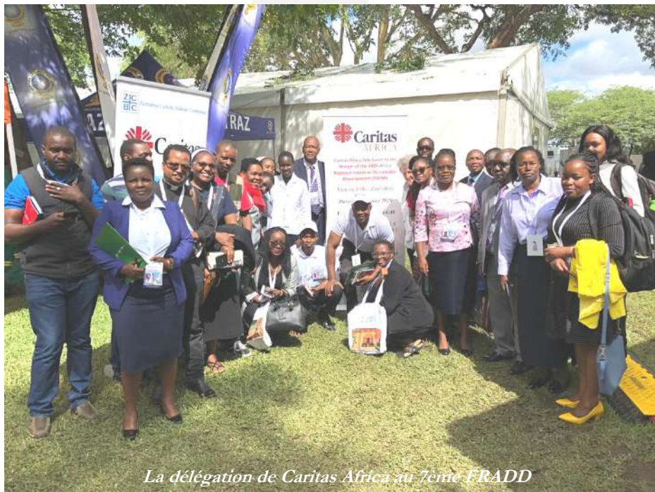
La délégation de Caritas Africa au 7ème FRADD

La délégation de Caritas Africa à ce forum était composée des représentants des Caritas suivantes : Liberia, Ouganda, RDC, Sierra Leone, Soudan du Sud, Zambie et Zimbabwe.