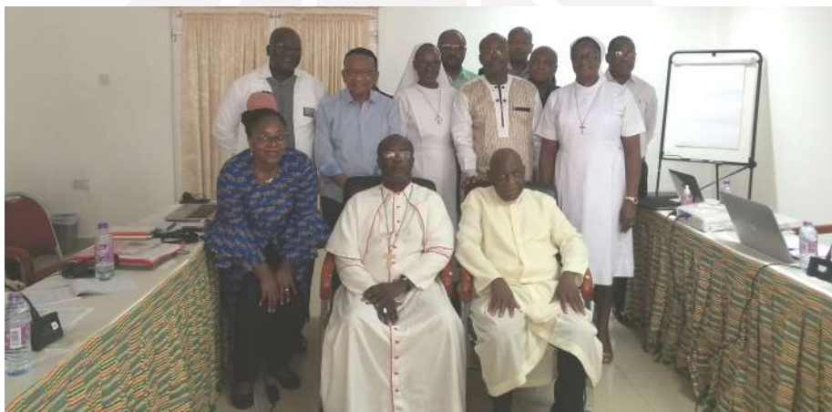
Photo de famille de la rencontre d'Accra en compagnie des délégations du SCEAM et de Caritas Ghana

La Commission Régionale Afrique (CRA) a tenu deux réunions statutaires ; la première en présentiel au mois de mars à Accra au Ghana et la deuxième en distanciel (virtuel) au mois de novembre.