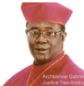
Archbishop Gabriel Justice Yaw Anokye

Chers frères et sœurs, La paix soit avec vous !