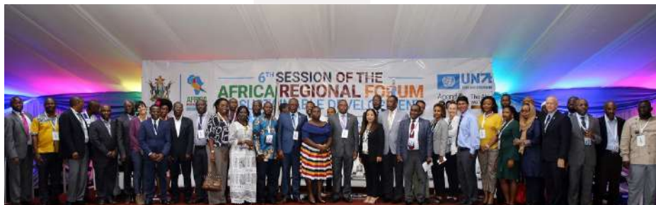
Photo de groupe de la 6 ème session du Forum régional africain.

En février, Caritas Africa a organisé un événement parallèle à l'occasion du Forum Régional Africain 2020 pour le Développement Durable, sous le thème "Partenariat avec les groupes confessionnels pour atteindre le développement